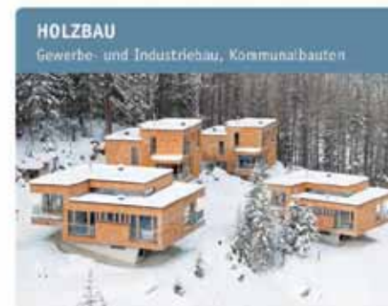
HOLZBAU Gewerbe- und Industriebau, Kommunalbauten

Wolfgang IG PASSIVHAUS TIROL Kennzeichen für internationalen Qualität und Weiterbildung htt15 holzbau team tirol