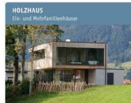
HOLZHAUS Ei- und Mehrfamilienhäuser

A-6145 Navis Außerweg 61b T +43/(0)52 73/64 34 F +43/(0)5273/64 34 - 40 info@schafferer.at